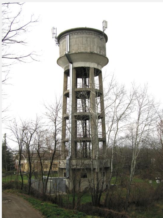
Zone Neutre Installazione di antenne su strutture di sostegno preesistenti