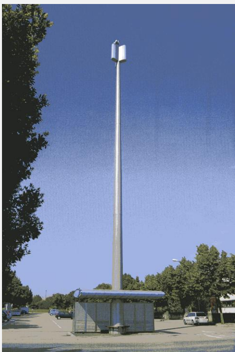
Zone Neutre Installazione di antenne su palo con elementi per la mimetizzazione