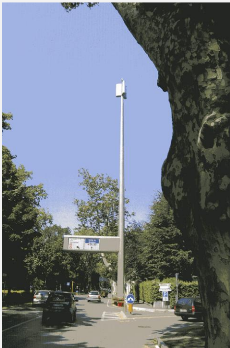
Zone Neutre Installazione di antenne su palo con elementi per la mimetizzazione