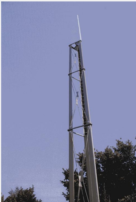
Zone Neutre Installazione di antenne su palo costituente arredo urbano