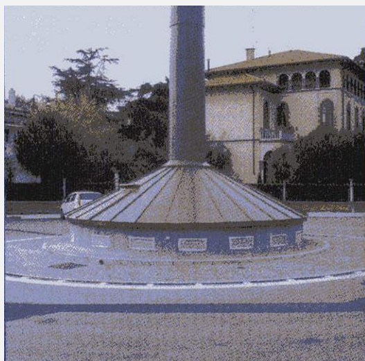
Zone Neutre Shelter mimetizzato