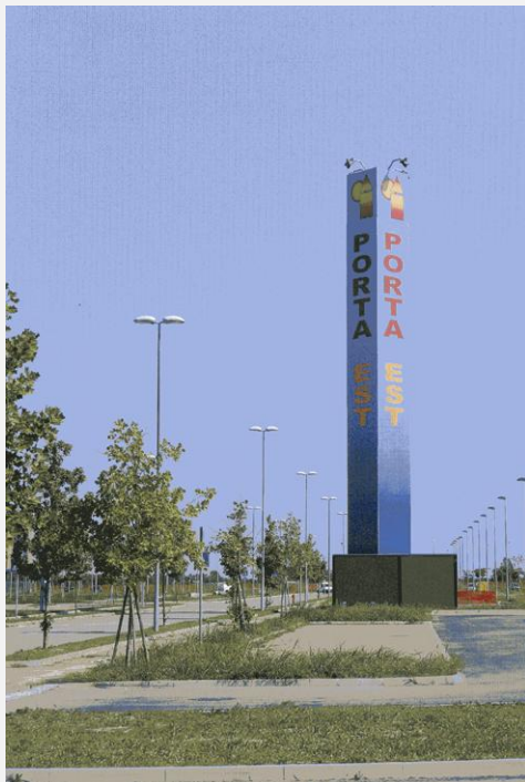
Zone Neutre Installazione di antenne su palo mimetizzato