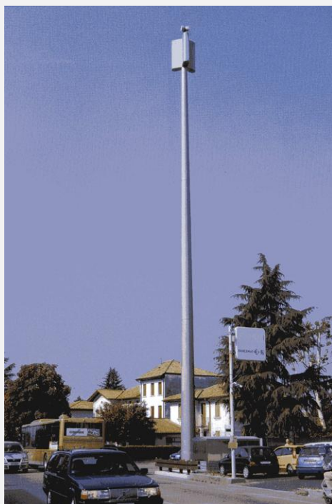
Zone Neutre Installazione di antenne su palo con elementi per la mimetizzazione