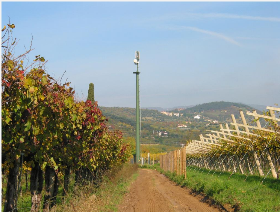
Zone Neutre Installazione di antenne su palo mimetizzato