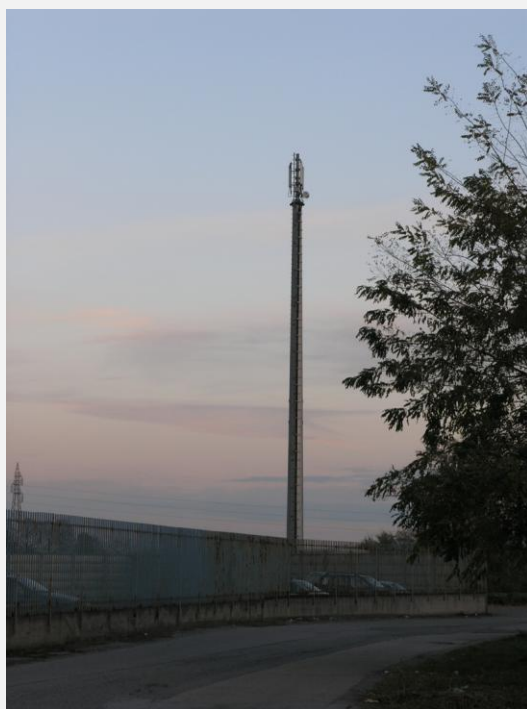
Zone Neutre Installazione di antenne su palo e co-siting