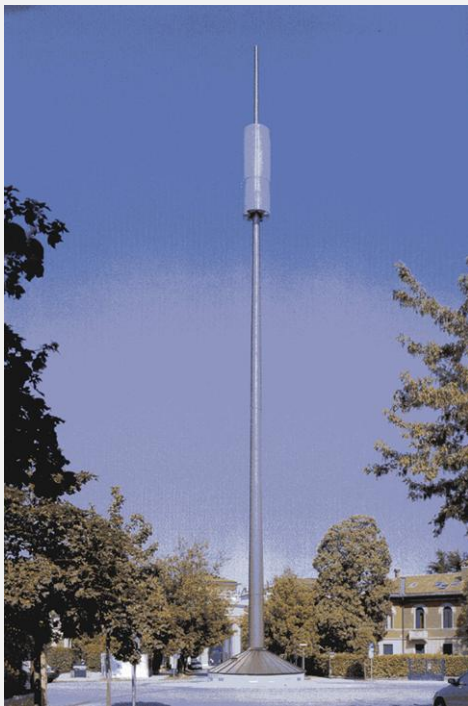
Zone Neutre Installazione di antenne su palo costituente arredo urbano